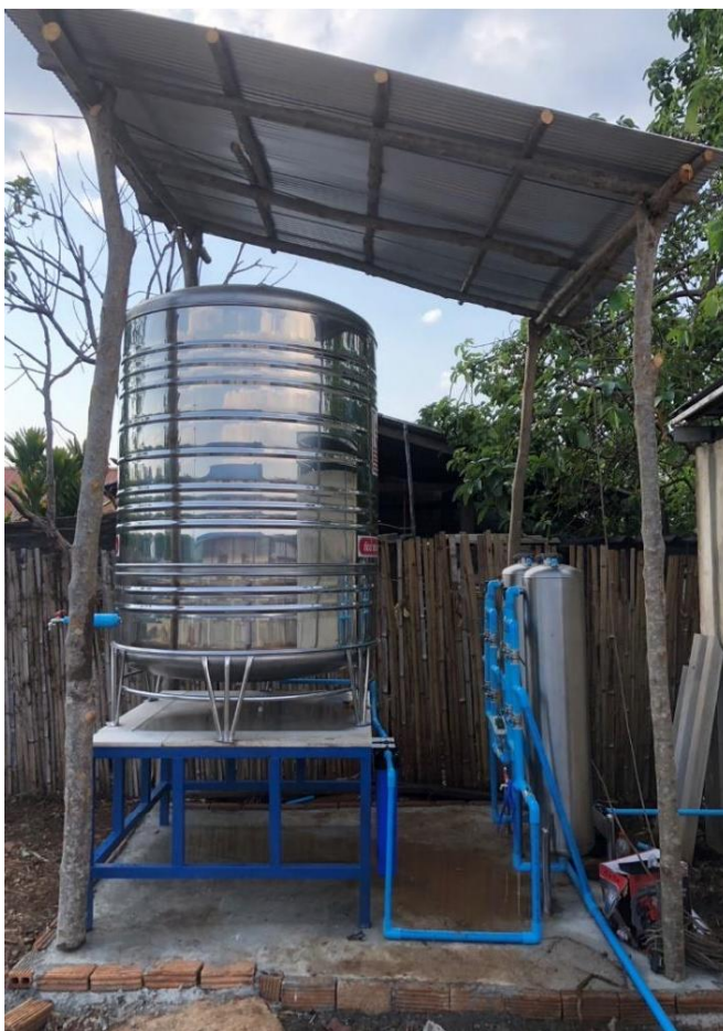
การติดตั้งระบบกรองน้ำแบบ UF